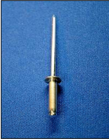
■形状及び基準寸法記号