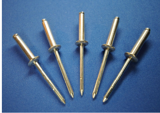
■ 形状及び基準寸法記号

締結のポピュラー商品として、 世界様々な業種のあらゆる用途に使われています。 また IFI 規格を始め、 ほぼ世界共通規格品となっています。